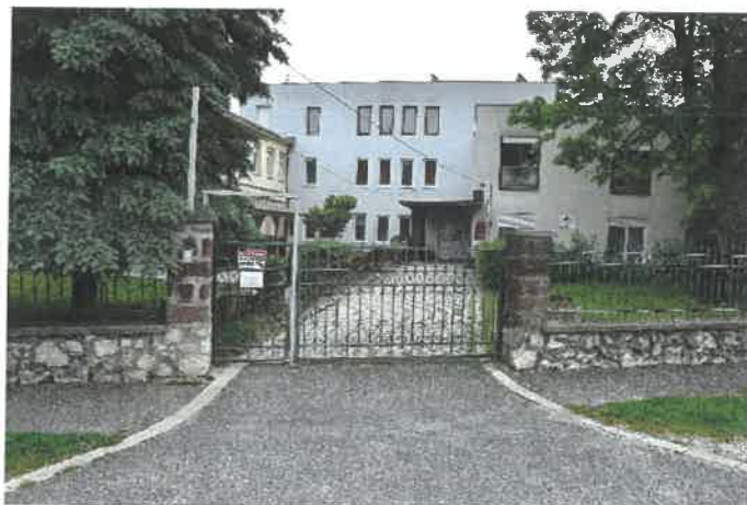
- Virágoskert Idősek Otthona