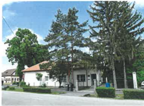
Lébényi Idősek Klubja