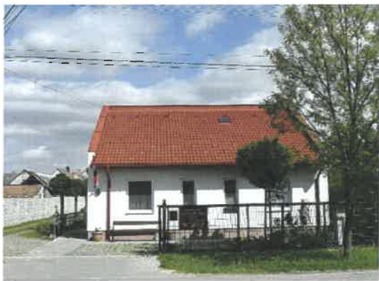
Jánossomorjai Idősek Otthona