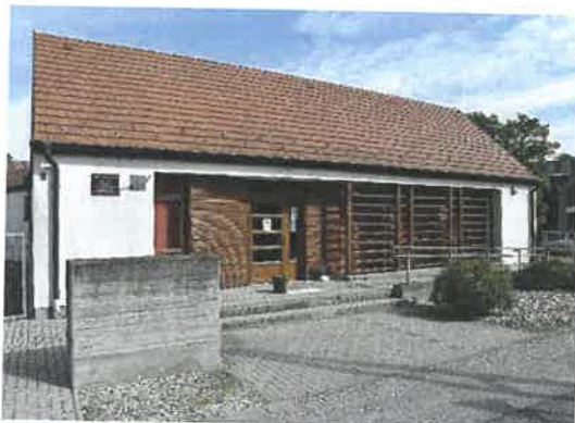
Az Alapszolgáltatási Centrum épülete